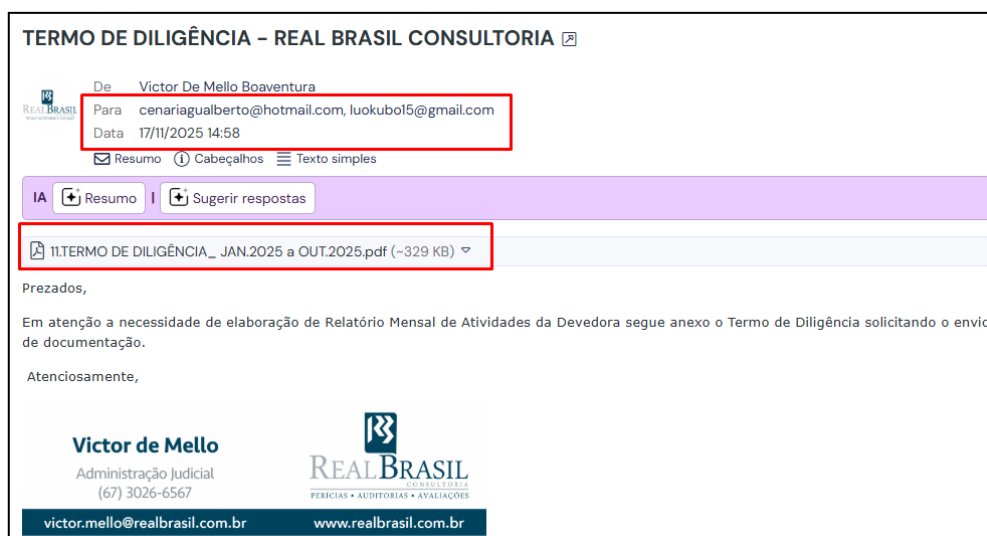
Imagem 1 – Termo de Diligência.

Conforme demonstra a imagem a seguir, no dia 17 de novembro de 2025, foi encaminhado termo de diligência aos únicos endereços eletrônicos informados pela Recuperanda para o recebimento de comunicações contábeis cenariagualberto@hotmail.com ; luokubo15@gmail.com .