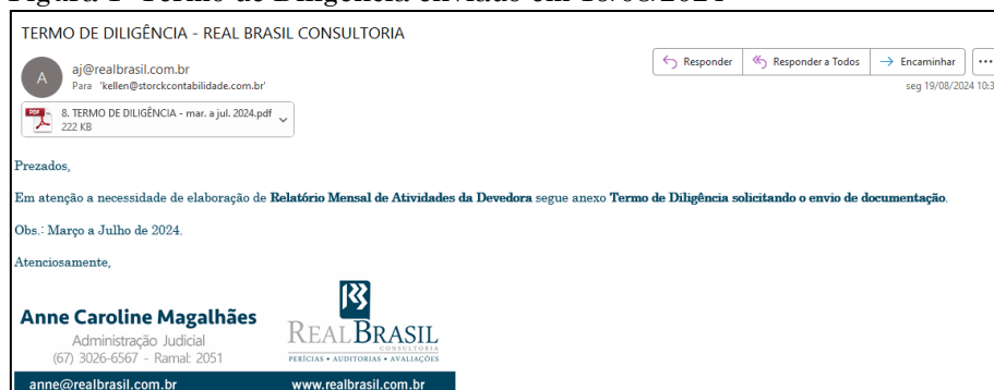
Figura 1: Termo de Diligência enviado em 19/08/2024

Por fim, ressaltamos a importância das documentações para análises financeiras para a elaboração do relatório mensal, estas devem ser enviadas no e-mail da administradora judicial, aj@realbrasil.com.br , separadas mês a mês, para que assim possa o relatório ser elaborado de forma correta e eficaz.