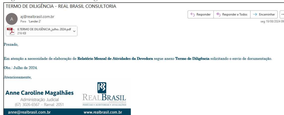
Figura 1: Termo de Diligência enviado em 19/08/2024

Por fim, ressaltamos a importância das documentações para análises financeiras para a elaboração do relatório mensal, estas devem ser enviadas no e-mail da administradora judicial, aj@realbrasil.com.br , separadas mês a mês, para que assim possa o relatório ser elaborado de forma correta e eficaz.