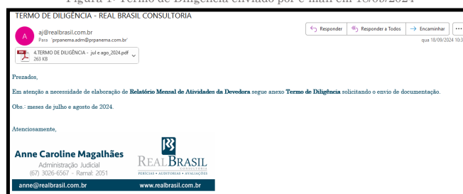
Figura 1: Termo de Diligência enviado por e-mail em 18/09/2024

Importante salientar que a Administradora Judicial envia Termos de Diligências solicitando a documentação contábil necessária , conforme segue: