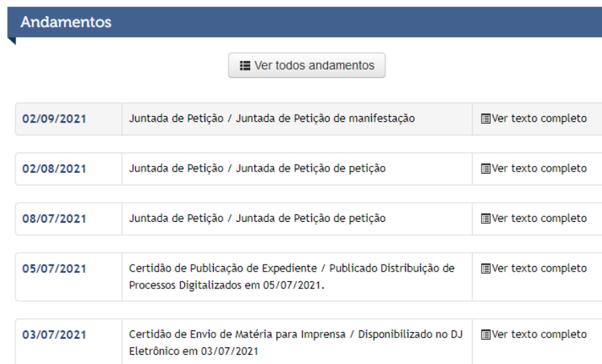
Figura 1- Informações sistema TJMT.