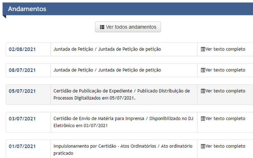
Figura 1- Informações sistema TJMT.