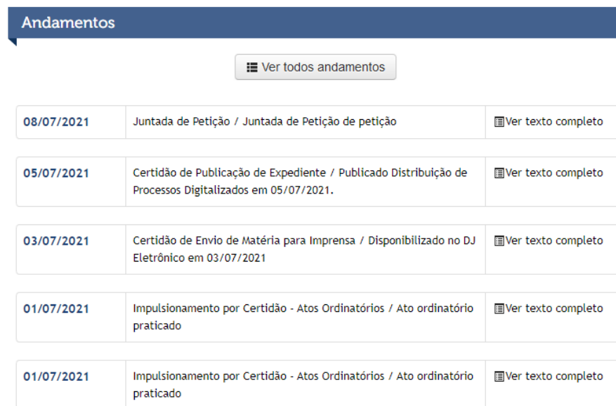
Figura 1- Informações sistema TJMT.