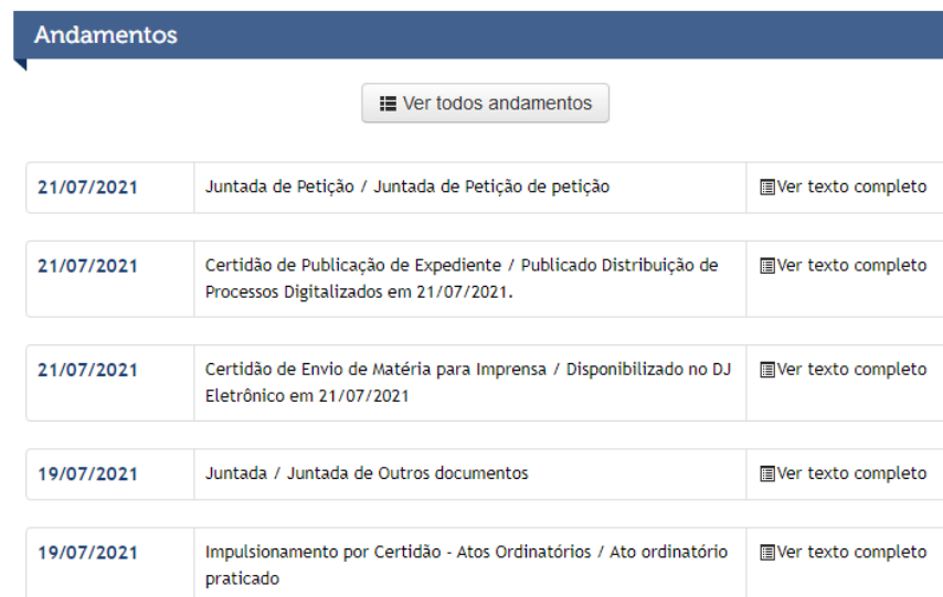
Figura 1: Andamento Processual.

*Consulta realizado pelo site http://pea.tjmt.jus.br/ , no dia 30/08/2021 às 16h53.