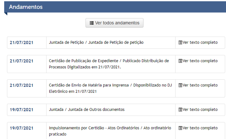
Figura 1: Andamento Processual.

*Consulta realizado pelo site http://pea.tjmt.jus.br/ , no dia 26/07/2021 às 16h53.