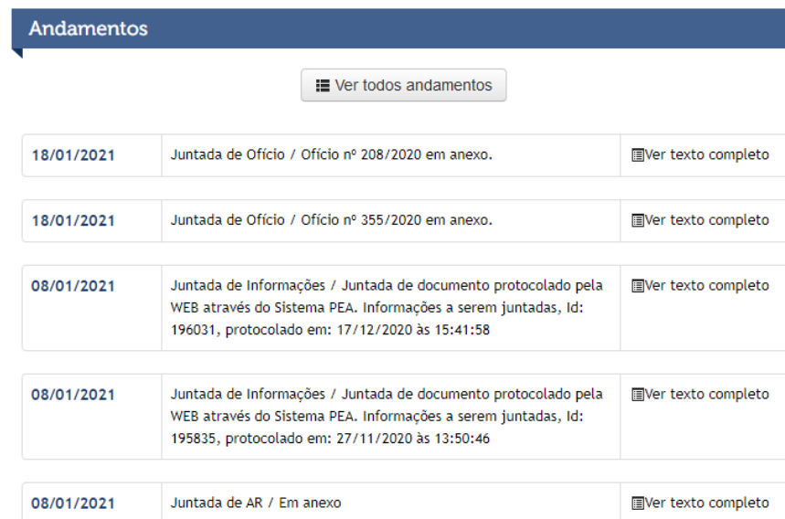
Figura 1- Informações sistema TJMT.