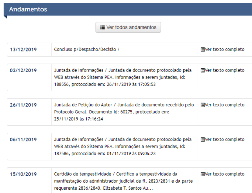
Figura 1- Informações sistema TJMT.