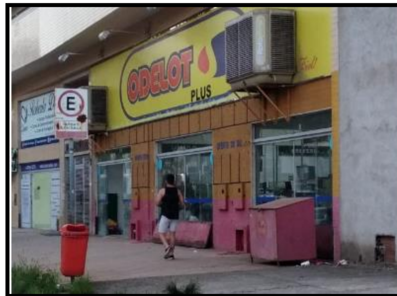
Figura 1- Imagem Loja Odelot: 10/03/2020

Já no interior da loja foi possível contatar que o estabelecimento se encontrava pouco abastecido e ao questionar a atendente esta informou que a loja estava com baixo estoque em razão da venda do estabelecimento para a Consul.