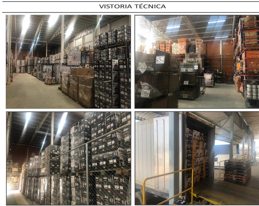
Figura 1- Vitoria Técnica da 16 de junho de 2019