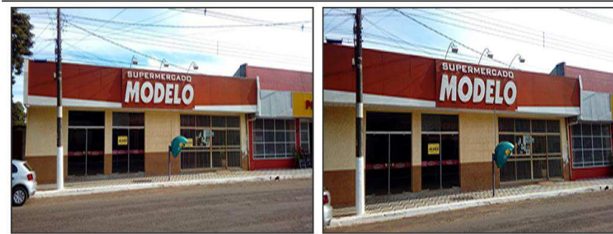
IMAGENS DO PRÉDIO ONDE FUNCIONAVA O MERCADO

Ao chegarmos ao local identificamos que não há quaisquer bens dentro da propriedade, estando esta limpa de qualquer resquício de funcionamento.