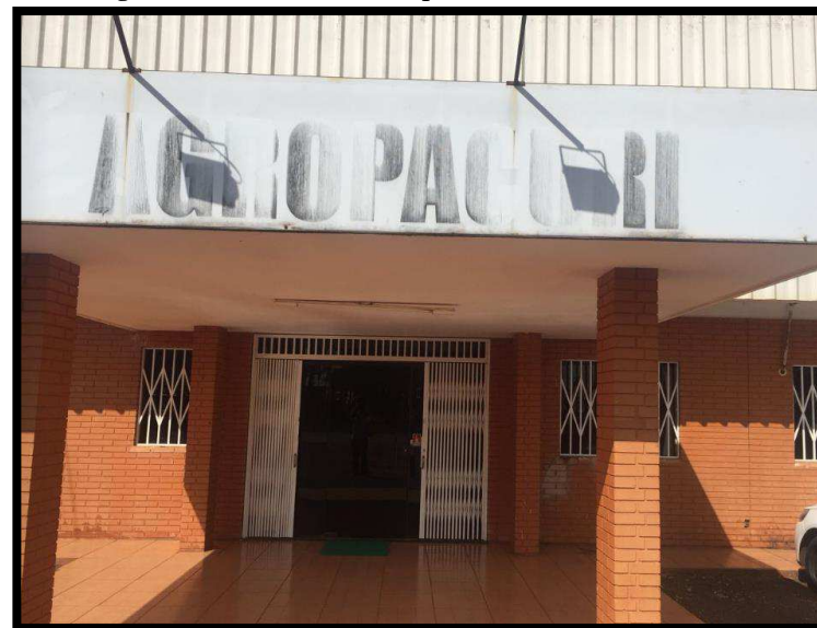
Figura 1- Imagens da fachada da empresa.

No local verificaram a presença de 2 funcionários uniformizados, sendo uma funcionária responsável pela limpeza, conservação e atendimento na recepção e o Sr. Tiago, o qual estava