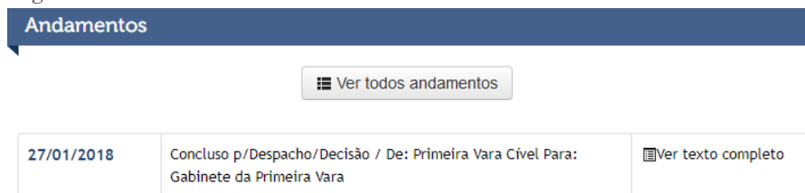
Figura 1- Consulta Processual *.

* http://servicos.tjmt.jus.br/processos/comarcas/dadosProcesso.aspx , realizada em 20/03/2018 às 14h33min.