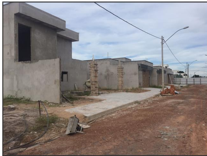
Figura 3 - Imagens da vistoria realizada.