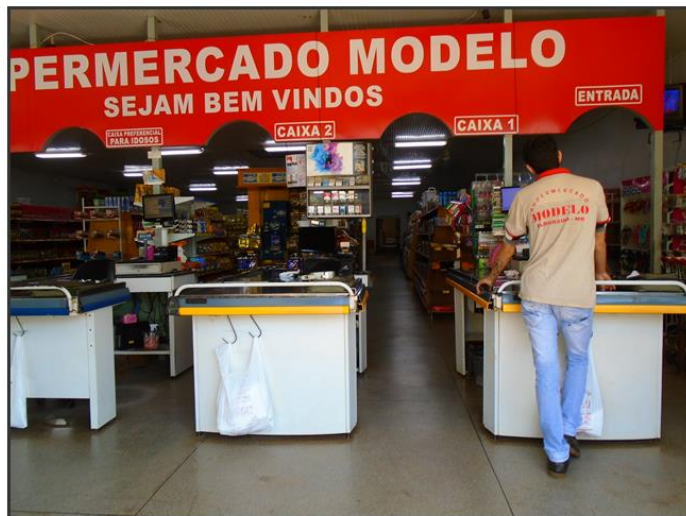
Figura 2 - Imagens da Dependência da Recuperanda.